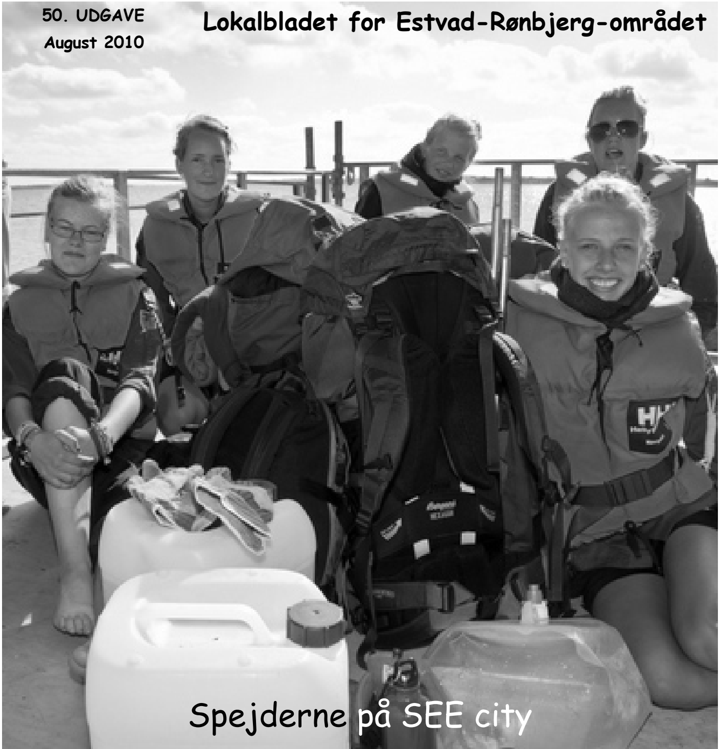
Spejderne på SEE city